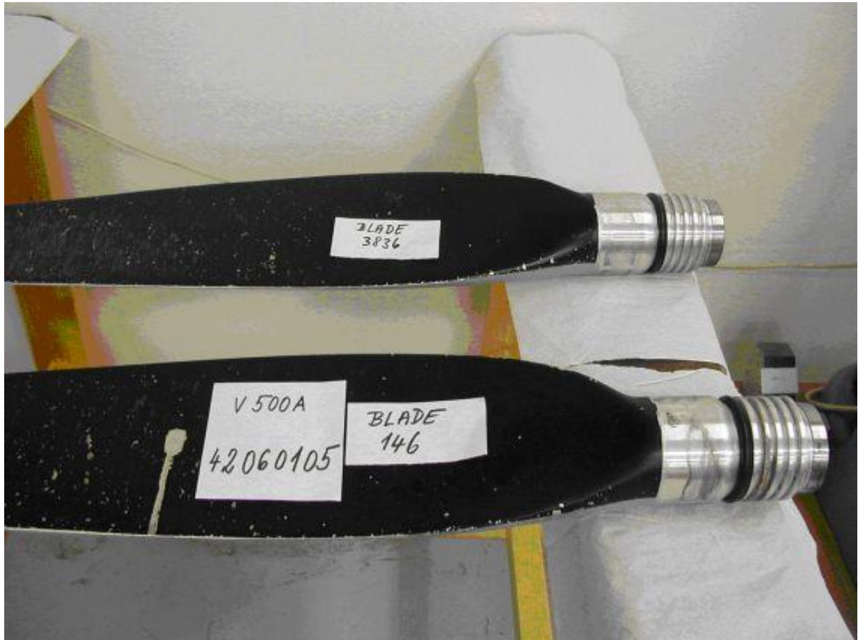
Fotografie - Avia Propeller